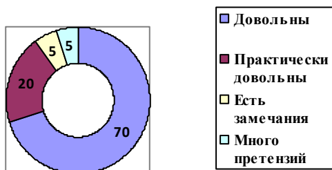
Довольны ли родители работой ДОУ